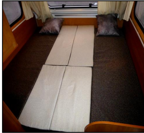
Maakuupaikka (185x60cm) Vuode (185x193cm)